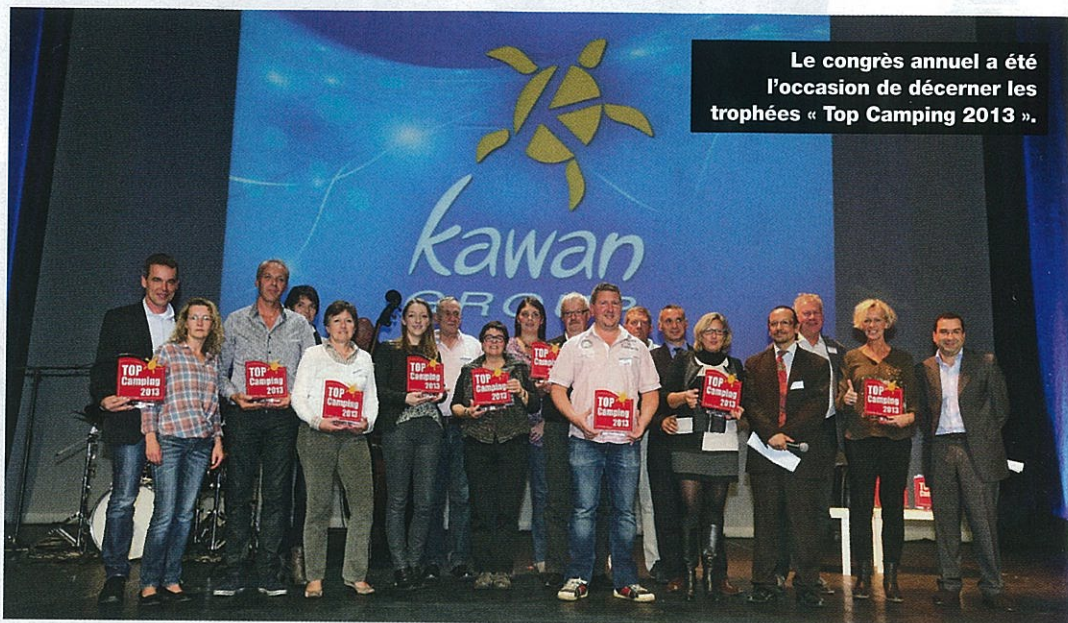
Le congrès annuel a été l'occasion de décerner les trophées « Top Camping 2013 ».

Où ? Au casino de La Grande-Motte (Hérault). Quand ? Du 3 au 5 novembre. Combien ? 160 personnes environ.